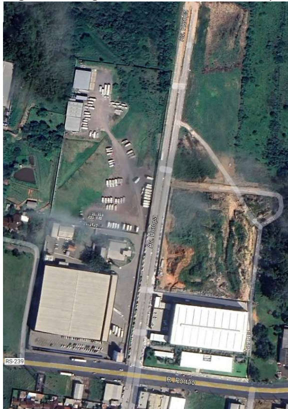
Figura 1: Imagem de satélite da Av. Europa.