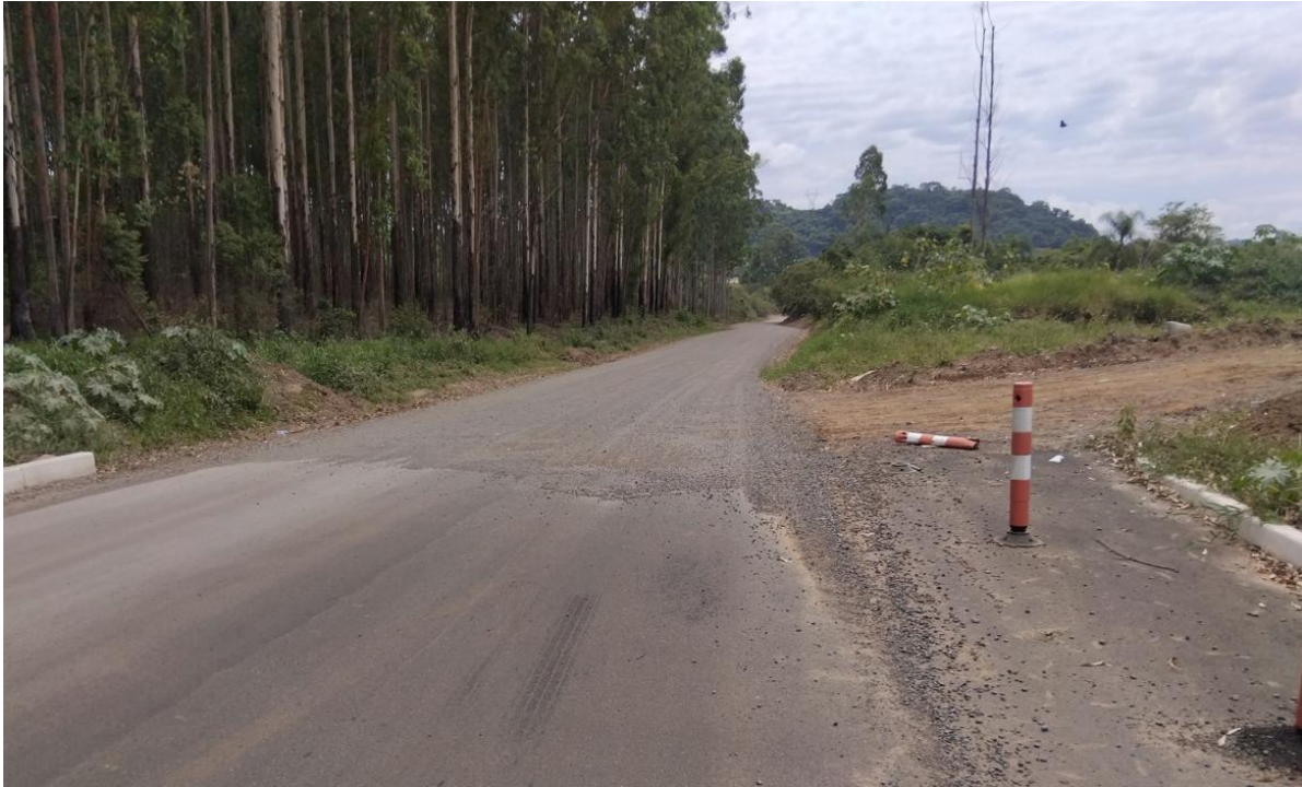
Imagem 2: Início do trecho (Rua Adriano de Quadros).